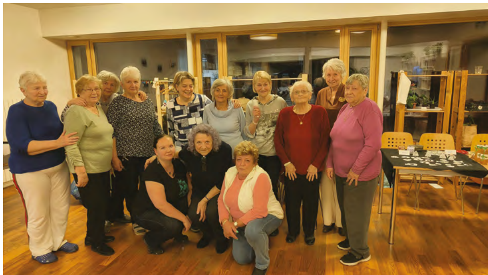
Dobrá nálada a spokojenost nás provázela po celé odpoledne