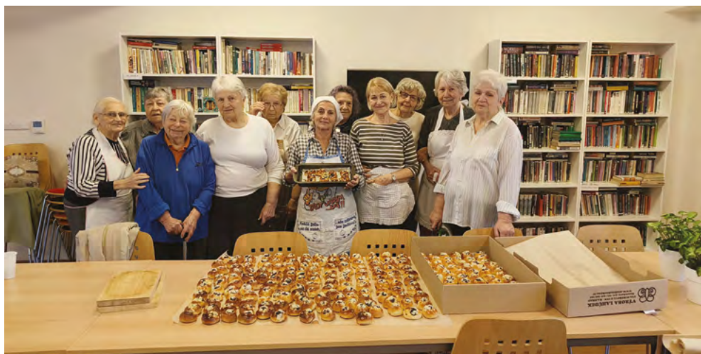
Příprava našich pekaček na vánoční jarmark