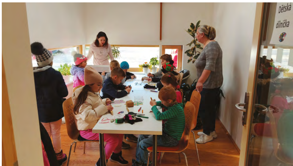
Vánoční tvoření dětí v dětské dílničce