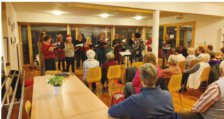
Skvělý koncert ženského komorního sboru z Brna Gloria Brunensis