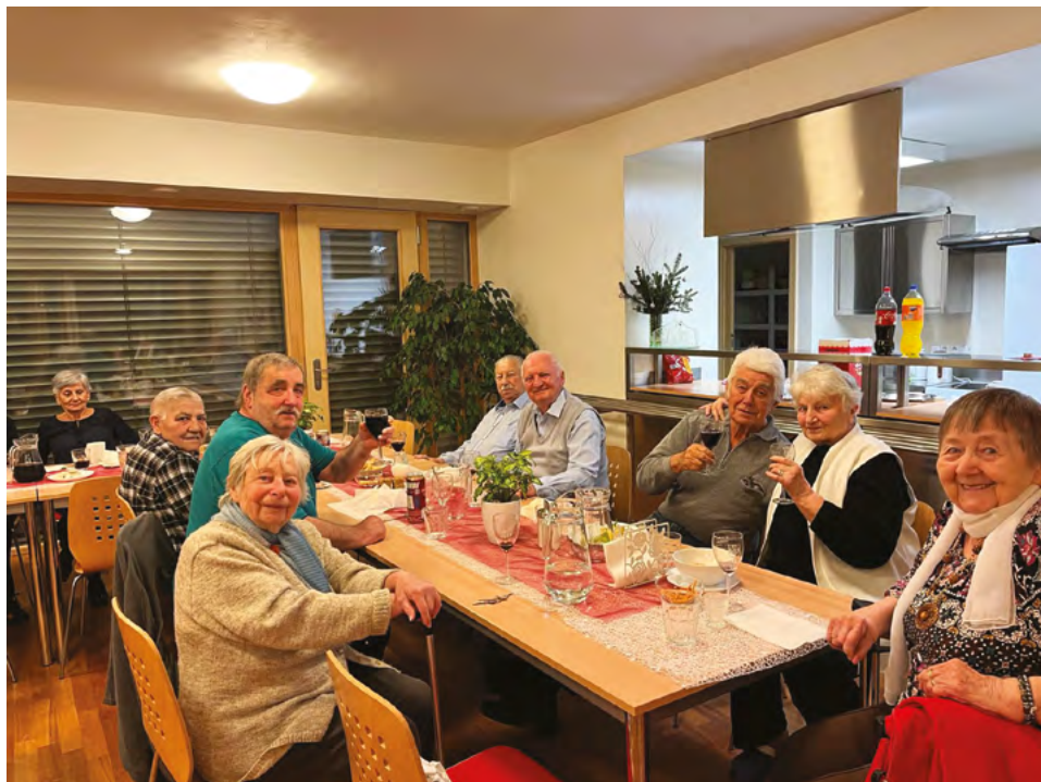
Vánoční večeřek seniorů v PBDS