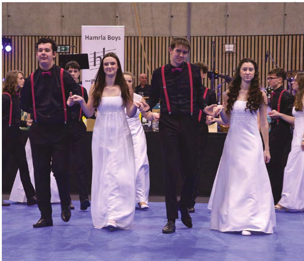
Úvodní předtančení žáků 9. tříd ZŠ na Městském plese.