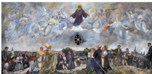
Chrám sv. Gotharda, nástropní malba Poutní zastavení, Rudolf Adámek, 1930

Pouť zahájíme ve 14.00 mší svatou v kostele sv. Gotharda