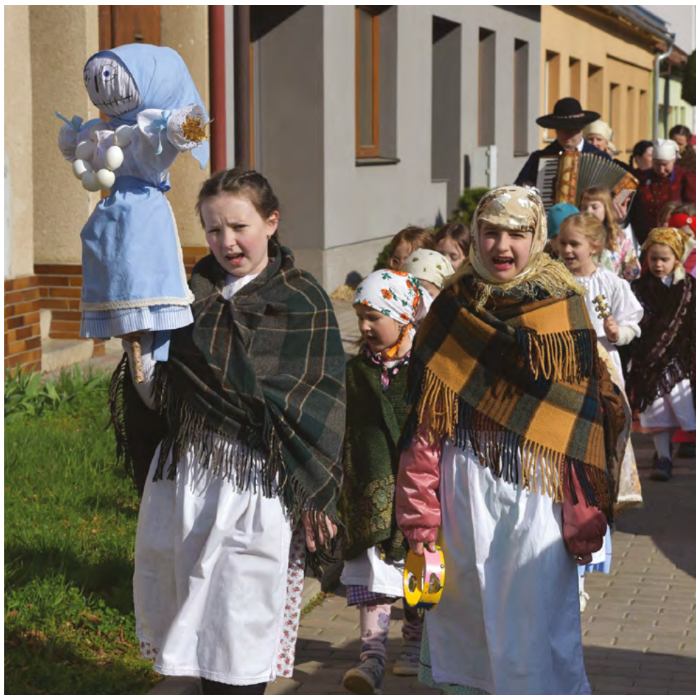
Vítání jara s folklorním kroužkem